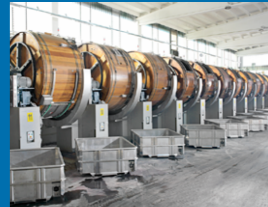
Reparto botti - Drums dept