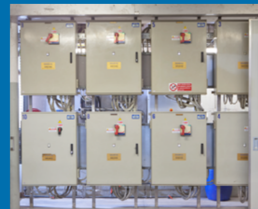
Sala quadri di potenza botti - Room power electric equipment

Sistema completamente automatico per il controllo dei bottali sia in modalità manuale che completamente automatica. Il sistema può dialogare con altri sistemi analoghi tramite rete di comunicazione in PROFIBUS-DP e consente il monitoraggio anche da supervisore remoto.