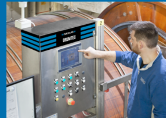
Quadro comando botte - Drum control pannel