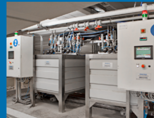
Impianto tipo - Typical plant