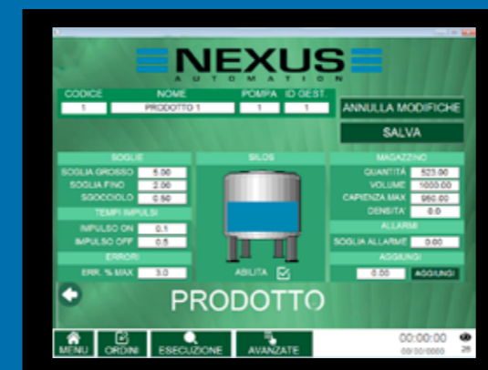
Console di comando - Control console