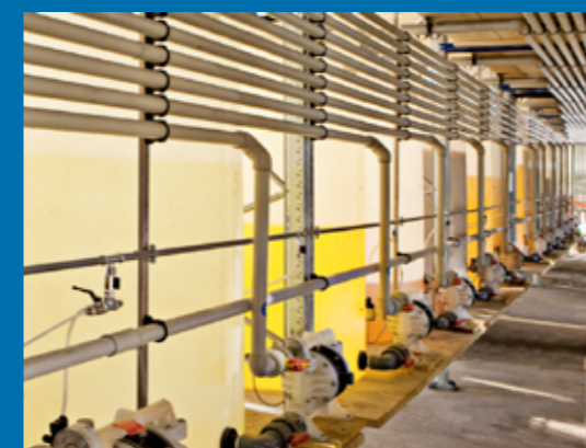
Magazzino cisterne - Tanks warehouse

È un sistema completamente automatico per il controllo del dosaggio e distribuzione a diverse utenze, di prodotti in grassi, resine, liquidi o polveri diluibili. Tramite una rete di comunicazione il sistema è in grado di interfacciarsi con altri sistemi dotati della medesima tecnologia e consente lo scambio reciproco di dati e/o il monitoraggio anche da supervisore remoto.