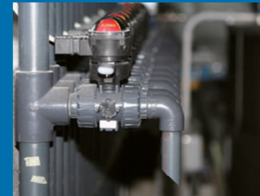
Impianto idraulico - Plumbing system