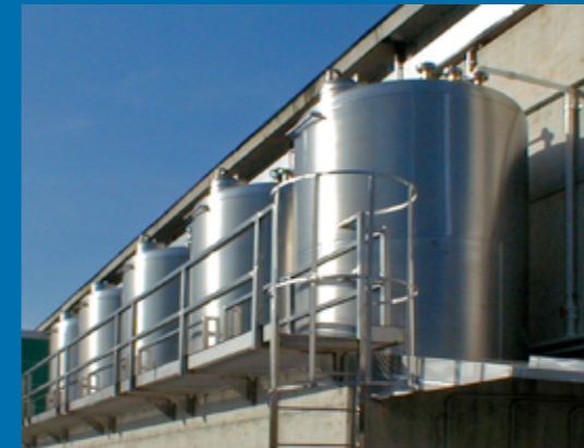
Magazzino prodotti - Product warehouse